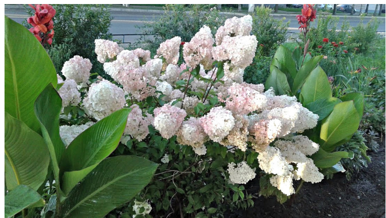
Вот такими пышными были кусты гортензии до ночного нашествия